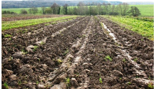
Labour après récolte