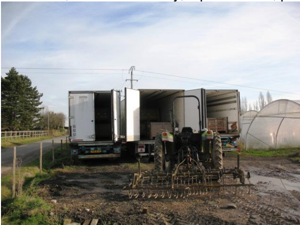
Semis frigo qui permettent de stocker les légumes hors gel

Ce qu'on appelle les « légumes de garde » sont les légumes racine (carottes, navets, betteraves, radis noirs, radis de Gournay, topinambours, pommes de terre, céleri rave...) qui sont récoltés avant