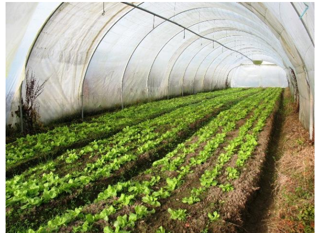
Merveille des glaces repiquée en extérieur et sous serre