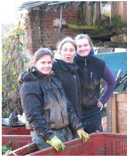
Petite pause ...

On vient de commencer la cueillette des épinards et des blettes de plein champ mais les pluies diluviennes ont pour l'instant arrêté la récolte. A Berneuil, on va cueillir avant les grosses gelées les pains de sucre repiqués en plein champ pour les mettre en chambre froide et alimenter les paniers en décembre et début janvier.