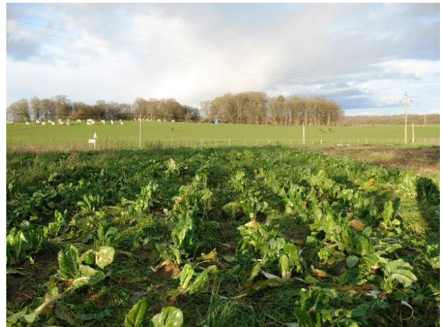
Blettes de plein champ