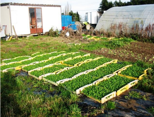
Plants de mâche et d'épinards à repiquer

A Marconville, toutes les serres sont déjà replantées en mâche, épinards et blettes, dont les premières sont déjà presque bonnes à récolter. A Berneuil, il faut encore nettoyer les serres, c'est-à-dire arracher les plants de tomates, aubergines, etc..., et préparer la terre pour repiquer les plants de mâche et d'épinards qui viennent d'arriver.