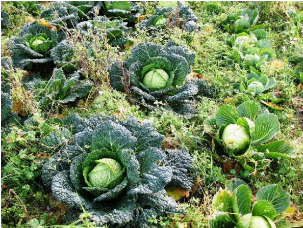
Choux verts et blancs à récolter

Les navets semés tardivement (c'était aussi un pari) sont récoltés en ce moment et distribués dans les paniers sous forme de bottes (petits navets très tendres). Reste encore à récolter une partie des carottes, des navets, des radis noirs, des choux, les topinambours, les dernières betteraves rouges. Pour les poireaux, l'arrachage se fait au fur et à mesure, il devrait y en avoir dans les paniers jusqu'au mois d'avril, vu le nombre d'hectares plantés cette année. Normalement on devrait réussir à terminer l'arrachage des légumes encore en terre d'ici une dizaine de jours. Dès que la récolte est terminée dans une parcelle, Loïc épand du fumier puis laboure : ensuite, les terres vont hiberner pendant l'hiver et seront retravaillées au printemps pour les premiers semis.