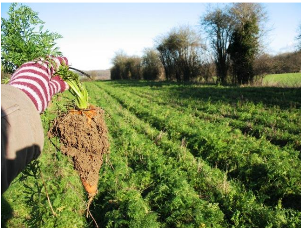
Champ de carottes à récolter