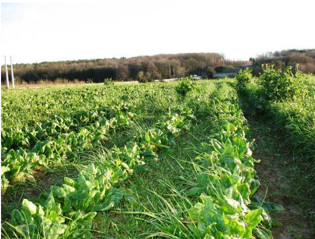
Epinards de plein champ

On vient de commencer la cueillette des épinards et des blettes de plein champ mais les pluies diluviennes ont pour l'instant arrêté la récolte. A Berneuil, on va cueillir avant les grosses gelées les pains de sucre repiqués en plein champ pour les mettre en chambre froide et alimenter les paniers en décembre et début janvier.